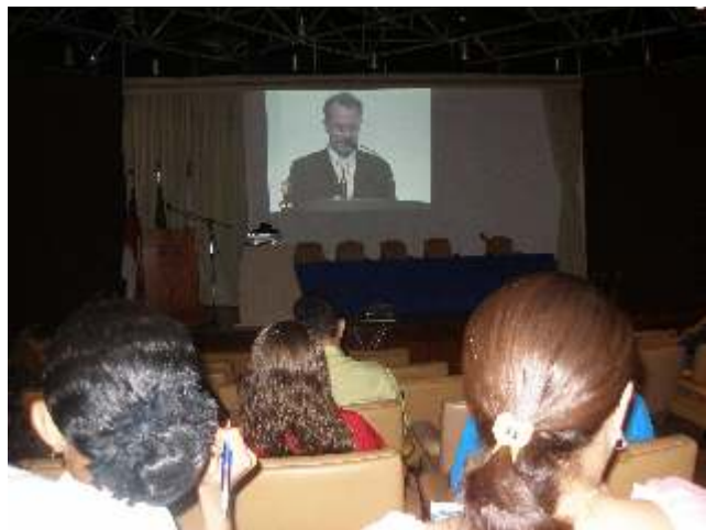
Telecongresso deu ênfase à difusão das áreas de Saúde, Segurança do Trabalho e Lazer

Pesquisa nacional da Organização Pan-Americana da Saúde, do Ministério da Saúde e da Sociedade Brasileira de Cardiologia, aponta que 27% dos industriários sofrem de hipertensão arterial e 8,5% apresentam níveis de colesterol elevados. Há também 15% de sedentários. O levantamento indica também que metade dos industriários está acima do peso e que 15% deste segmento são obesos.