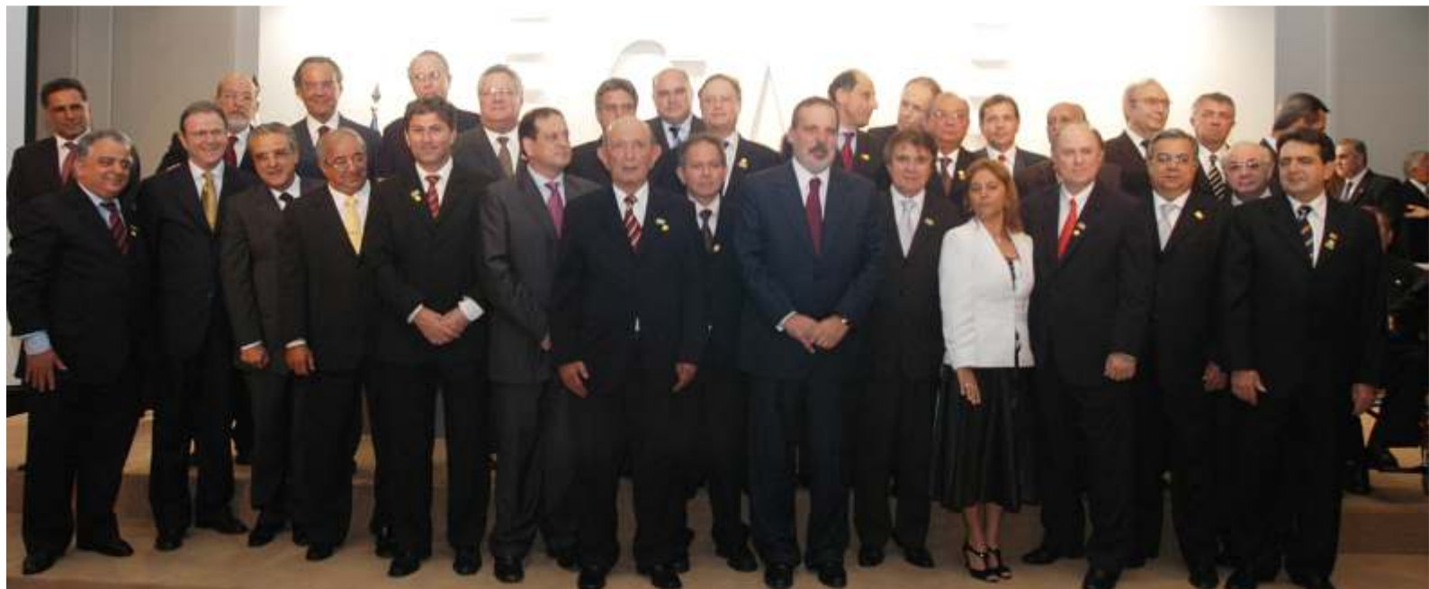
Nova diretoria da CNI é empossada