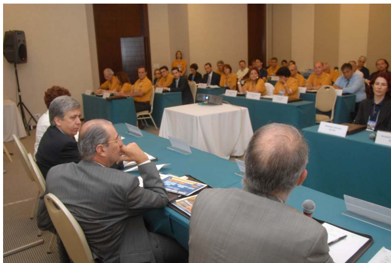
Novo estatuto do IEL em discussão

O IEL está com inscrições abertas para o programa Estratégia de Negócios para o Mercado Asiático. A iniciativa foi elaborada sob medida para executivos brasileiros que têm interesse no mercado da Ásia. O curso consta de dois módulos, a serem realizados no campus do Insead de Cingapura, nos dias 15 a 24 de março de 2007, e em Xangai, China, onde haverá seminários e visitas a empresas, nos dias 25 a 28 de março de 2007.