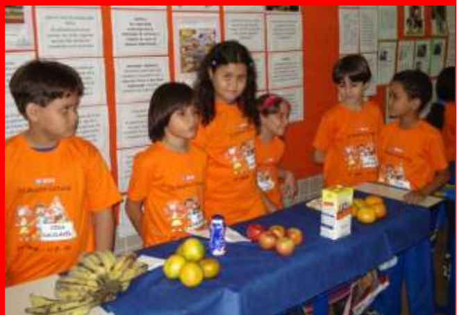
Alunos da 2ª série da Unidade 2 participam da IV Mostra Cultural

Feira dos Municípios - Alunos de 5ª a 8ª série da Unidade 3 realizaram em 10 de novembro a 1ª Feira Cultural dos Municípios, que transformou as salas de aula em vitrine de Manaus, Itacoatiara, Parintins, Manacapuru, Presidente Figueiredo, Codajás, Coari e Barcelos, os municípios pesquisados e que tiveram atividades econômicas, culturais, turísticas, históricas e políticas enfocadas no evento.