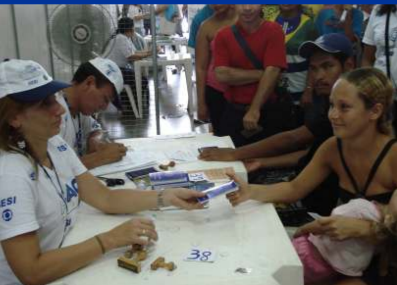
Serviço médico para todas as idades