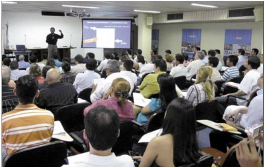
Treinamento na sede da FIEAM reuniu representantes das 92 empresas da região Norte selecionadas pelo Prime

Criado este ano como parte do Plano de Ação 2007/2010 de Ciência e Tecnologia e Inovação para o Desenvolvimento Nacional, do Ministério da Ciência e Tecnologia, o Prime teve aprovadas mais de 1.800 empresas em todo o país, selecionadas a partir de dois critérios básicos, a idade nascente - obrigatoriamente de zero a 2 anos - e a caracte-