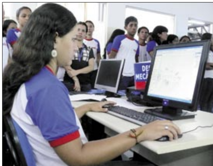
Alunos do SENAI visitam local do simulado de Desenho Mecânico em CAD, no CFP-WL