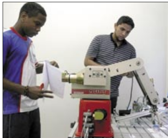
Dupla de competidores da ocupação Mecatrônica