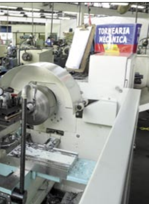
Aluno de Mecânica de Refrigeração que tiveram provas simuladas no final de julho