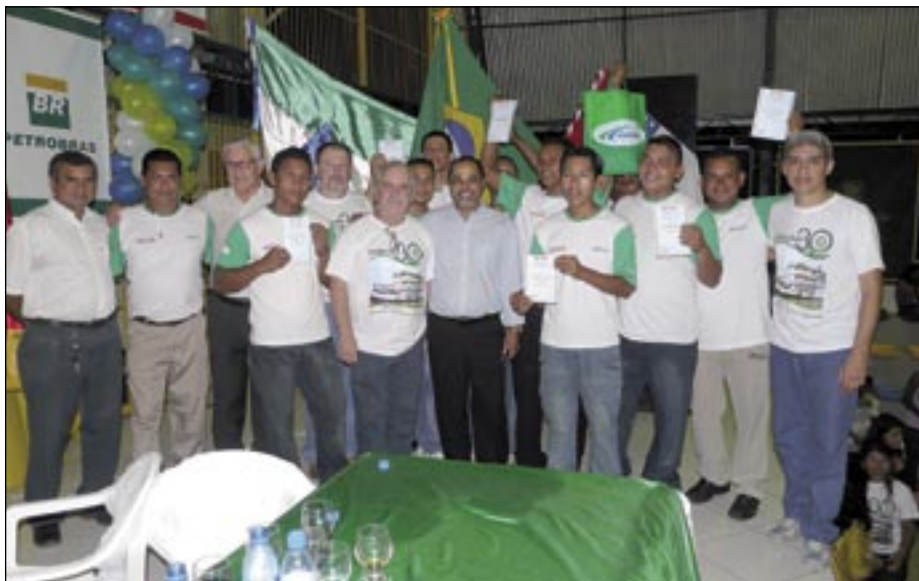
Junto com diretores do Sistema FIEAM, moradores de Tefé exibem seus certificados obtidos nos cursos do Samaúma

Em 2008, o Serviço Social da Indústria (SESI Amazonas) tornou-se o mais novo parceiro do Samaúma com a integração do Programa Cozinha Brasil, que leva à população ribeirinha cursos de Educação Alimentar.