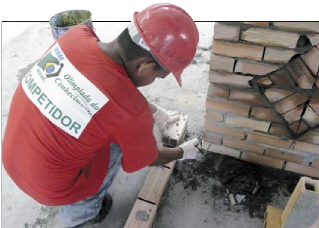
Aluno da ocupação Construção Civil Alvenaria (pedreiro) constrói parede durante a última etapa do simulado no CIET