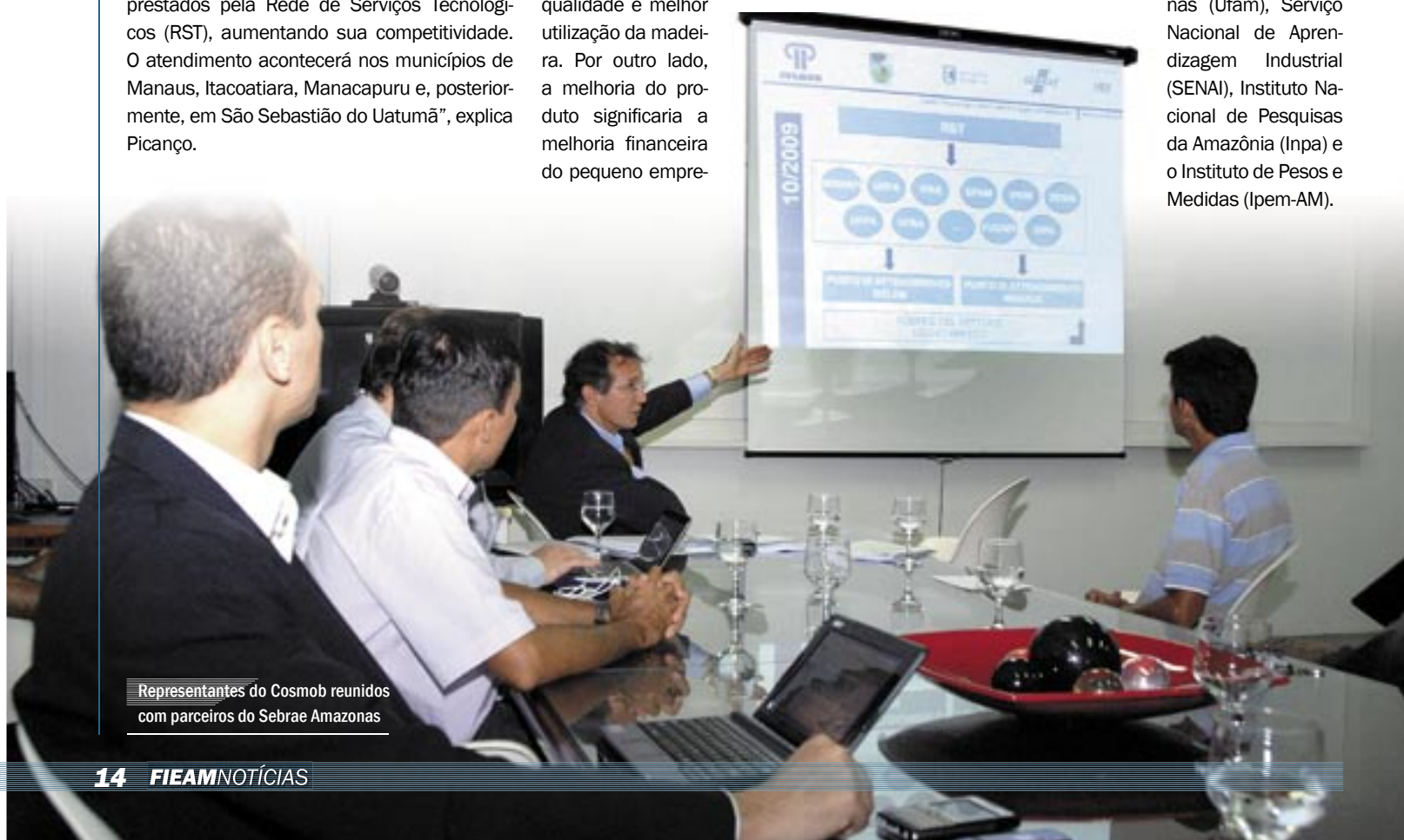
Representantes do Cosmob reunidos com parceiros do Sebrae Amazonas

O plano de ação por meio da RST tem duração de quatro anos (2009-2012) e contará com as instituições tecnológicas, parceiras do Sebrae na RST, Centro de Análise, Pesquisa e Inovação Tecnológica Fucapi, Universidade Federal do Amazonas (Ufam), Serviço Nacional de Aprendizagem Industrial (SENAI), Instituto Nacional de Pesquisas da Amazônia (Inpa) e o Instituto de Pesos e Medidas (Ipem-AM).