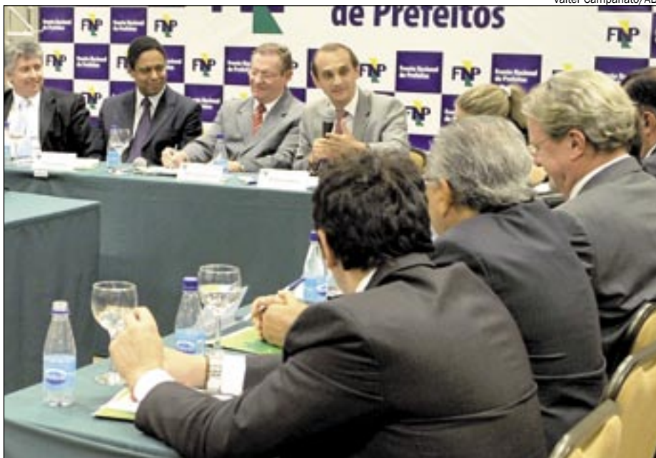
Primeiro encontro de prefeitos de cidades-sedes da Copa de 2014, em julho, com os ministros Márcio Fortes (Cidades), Orlando Silva (Esportes) e Luiz Barreto (Turismo)

Em função de Manaus ser uma das sedes da Copa do Mundo de 2014, o Sebrae no Amazonas deu início a uma série de reuniões com representantes do Sebrae Nacional, Governo do Estado e Prefeitura de Manaus para a elaboração de um projeto que vai oferecer capacitação, assessoramento, treinamento, oportunidade de formalização e informações aos empreendedores e grupos associativos da cadeia produtiva do turismo na capital e região metropolitana.