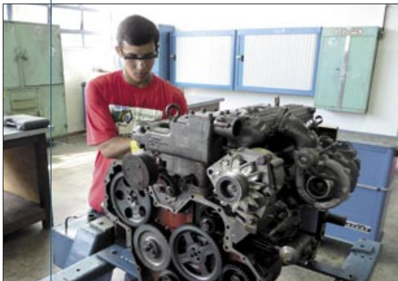
Aluno competidor da ocupação Mecânica Diesel durante simulado no CPF-WL

nal Waldemiro Lustoza (CFP-WL), unidade do bairro Cachoeirinha, e no Polo Moveleiro de Itacoatiara, onde o SENAI Amazonas mantém a Agência de Treinamento Ernesto Thalheimer (ver quadro com unidades e ocupações correspondentes).