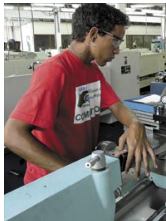
Tornearia Mecânica é uma das oito ocupações localizadas no CPF

As provas do simulado da Olimpíada do Conhecimento foram aplicadas no Centro de Ensino Tecnológico Antonio Simões (CE-TAS) e no Centro Integrado de Educação do Trabalhador (CIET), ambos no Distrito Industrial; no Centro de Formação Profissio-