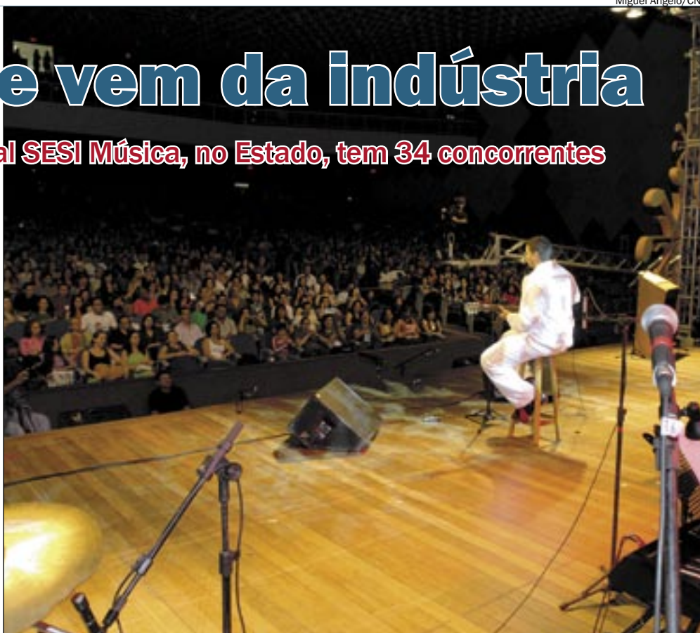
Festival foi lançado ano passado, em edição nacional, com a participação de dois trabalhadores do Amazonas

Nas três noites do festival – duas elimi-