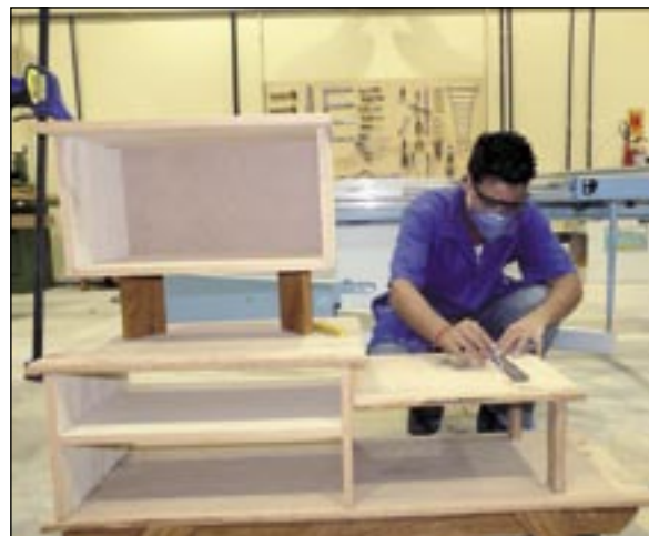
A ocupação Marcenaria também teve provas no CIET

CAMC : Confecção do Vestuário : Mecânica de Refrigeração