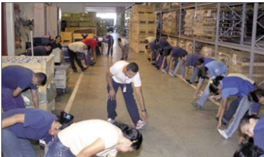
O programa SESI Ginástica na Empresa é desenvolvido em 38 empresas do Pólo Industrial de Manaus

Em todo o país, o programa SESI Ginástica na Empresa atende diariamente 750 mil trabalhadores de 2,5 mil indústrias. Só no Amazonas, são atendidos pelo menos 17 mil trabalhadores de 38 empresas do Pólo