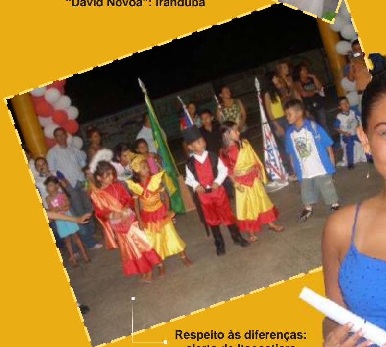
Respeito às diferenças: alerta de Itacoatiara