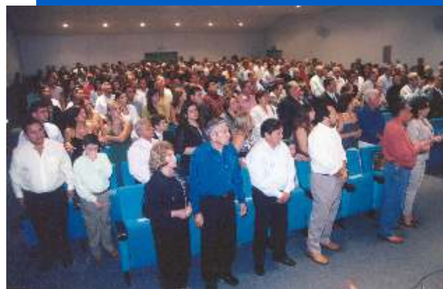
Cerca de 300 convidados na solenidade