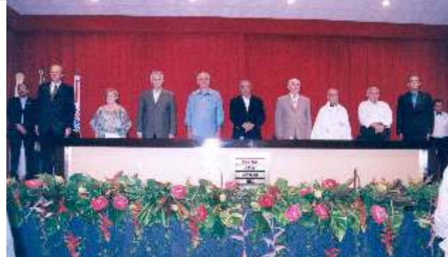
Mesa diretora do evento