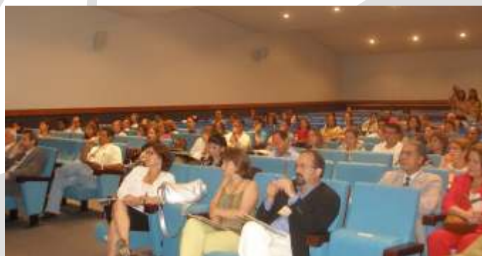
Representantes de empresas e do SESI: participantes