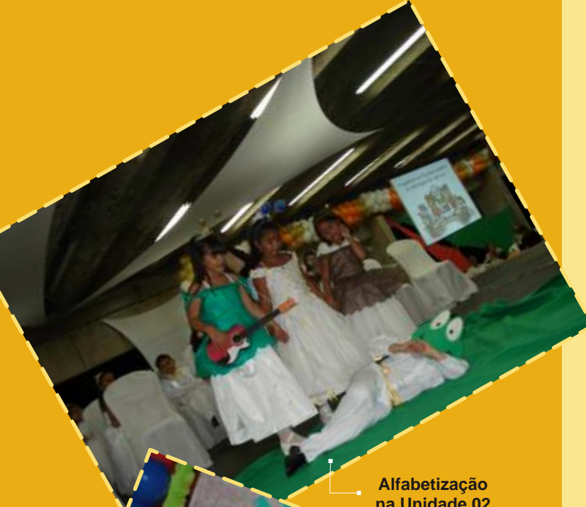
Alfabetização na Unidade 02