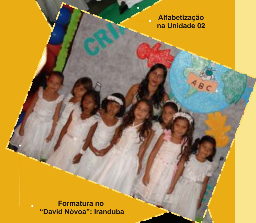
Formatura no "David Nóvoa": Iranduba