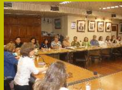
Sistema FIEAM: voluntariado