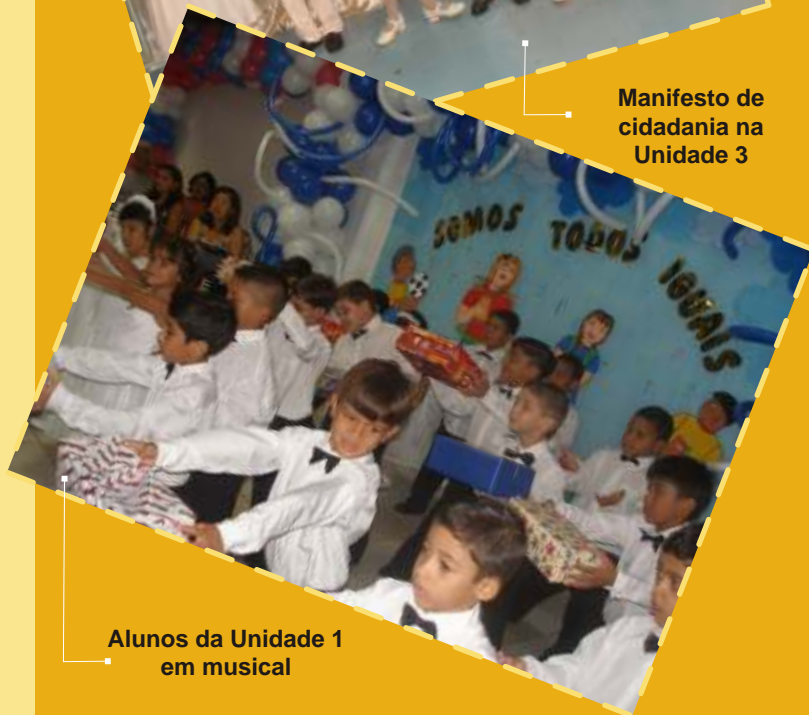
Alunos da Unidade 1 em musical