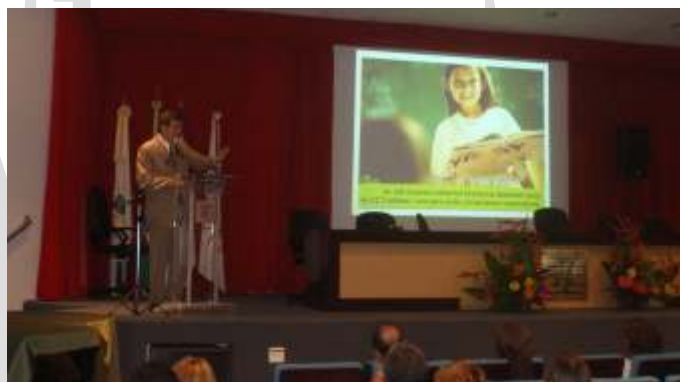
Gargioni: imagem empresarial fortalecida