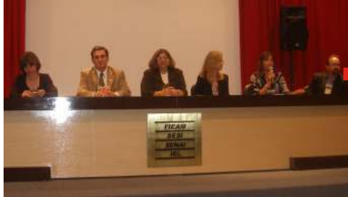
Fórum reuniu especialistas de vários Estados