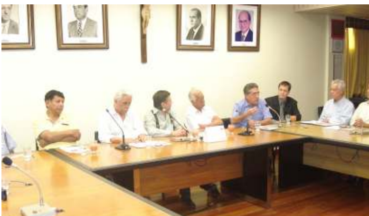
Empresários peruanos desejam intercâmbio com o Amazonas