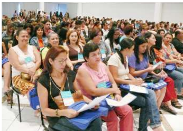
Professores do SESI participam do Congresso em Manaus