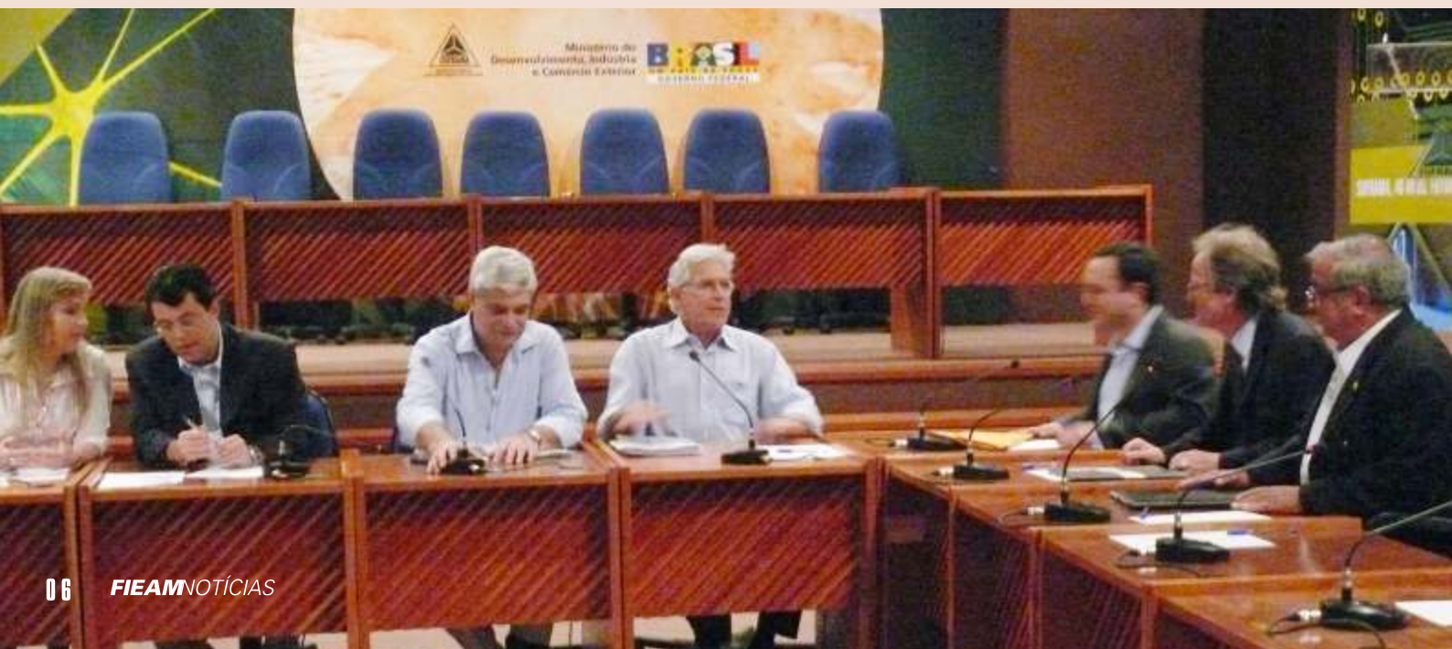
Ministro Miguel Jorge Filho (ao centro)

Se o Governo Federal não tem como intervir na guerra fiscal entre Amazonas e São Paulo, o ministro do Desenvolvimento, Indústria e Comércio (MDIC), Miguel Jorge Filho, garantiu aos empresários que em até 40 dias deve ser definido o Processo Produtivo Básico (PPB) para o setor de cosméticos, reivindicação da classe empresarial do Estado para a instalação do Pólo de biocosméticos e fitoterápicos. Segundo o ministro, o trabalho já está em fase de consulta e nos próximos 30 a 40 dias devem ser concluídos e liberados os primeiros PPBs para o setor de cosméticos. O ministro garantiu aos empresários um PPB mais flexível que irá possibilitar investimentos do ramo de cosméticos, principalmente para o PIM.