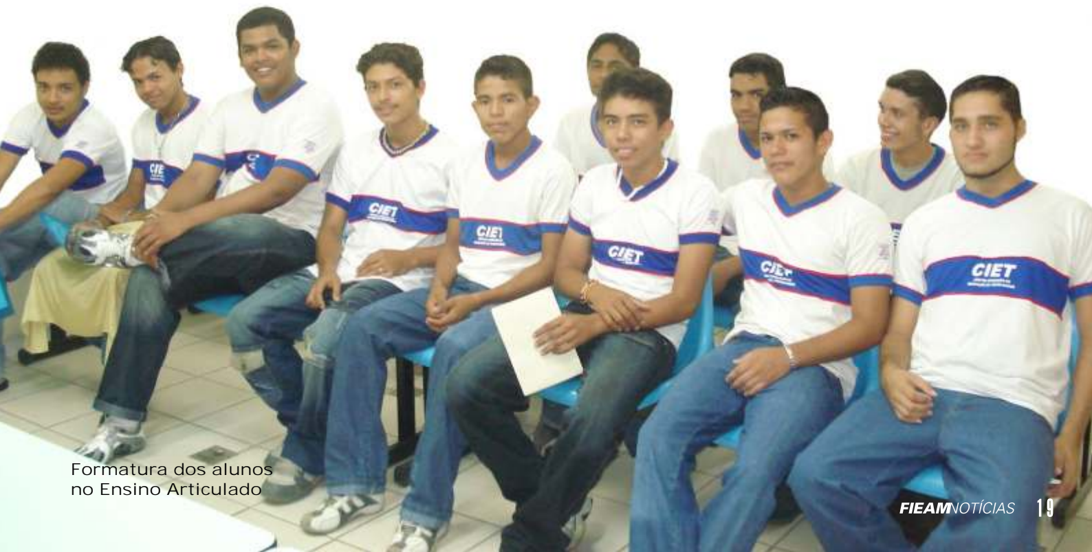
Formatura dos alunos no Ensino Articulado

Para conseguir uma vaga no Ensino Articulado, os alunos foram submetidos a processo seletivo, com provas descritivas de matemática, português e redação. Mais de 90 candidatos se inscreveram e tiveram que comprovar o ensino fundamental de 1ª a 4ª série.