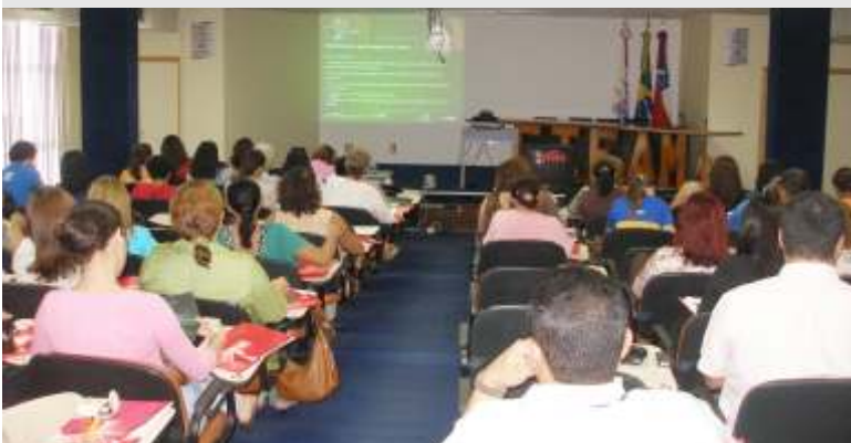
Profissionais da área de educação prestigiam lançamento do PSQE

A cerimônia de premiação ocorrerá em 11 de junho de 2008, em Brasília. O 1º lugar receberá troféu, certificado de participação, visita a uma escola de referência na América Latina, publicação da experiência no Observatório de Boas Práticas da Unesco, e R$ 20 mil; 2º lugar, R$15 mil; 3º lugar, R$ 10 mil; 4º e 5º lugares R$ 5 mil.