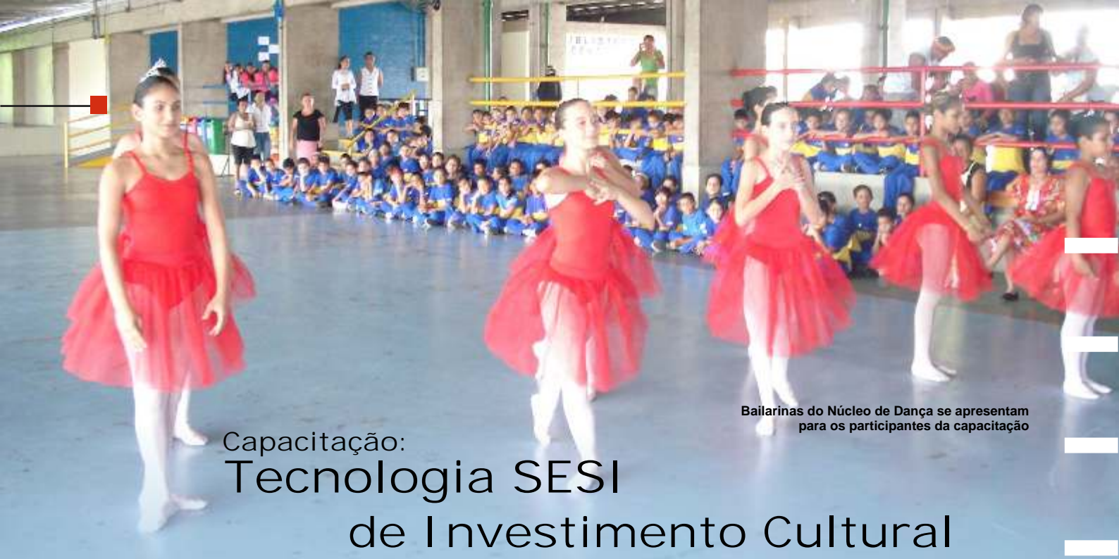
Bailarinas do Núcleo de Dança se apresentam para os participantes da capacitação