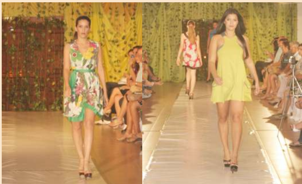
Coleção Tendências Verão 2008 na passarela do Toscana

Márcia há oito anos trabalha com costura e diz que sua visão foi ampliada para os negócios, após integrar o projeto do Sebrae Amazonas. "Temos diversificado a produção, antes voltada exclusivamente a fardamentos e uniformes, e quadruplicamos a mão-de-obra. Hoje, a empresa conta com 12 costureiras, contra as três inicialmente, e aumentamos em pelo menos 30% a produção mensal, atualmente estimada em 100 peças só