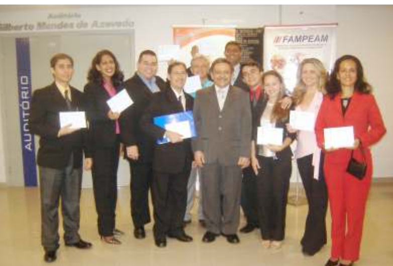
Formandos dos cursos oferecidos pela Comenpec recebem certificado