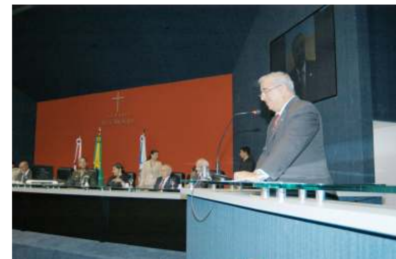
Presidente da FIEAM se emociona durante discurso no Plenário "Ruy Araújo"

1995, vice-presidente da Confederação Nacional da Indústria (CNI) e membro titular do Conselho de Representantes da CNI, o engenheiro é defensor de políticas para o desenvolvimento econômico e social do Estado.