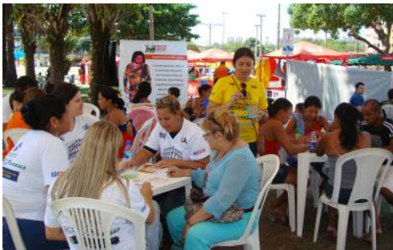
Estande do SESI Cozinha Brasil, onde o público recebeu informações sobre o programa de educação alimentar

Trabalhadores da construção civil e seus familiares estiveram no centro das comemorações, em Manaus, do Dia Nacional da Construção Social, em 2 de agosto, com extensa programação desenvolvida durante todo o dia no Centro Social Urbano (CSU) do Parque 10, na Zona Centro-Sul.