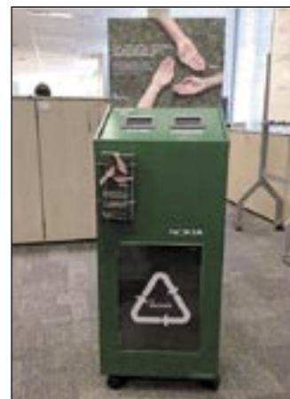
Uma das urnas da Nokia instaladas nas dependências do SESI Amazonas

A Nokia possui uma rede de reciclagem em cooperação com empresas que operam em conformidade com as normas de segu-