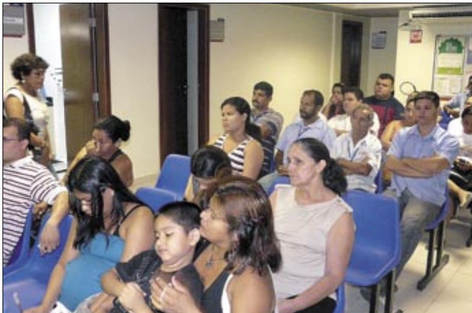
As palestras têm sido um dos principais elementos da campanha do Programa Homem Saudável do SESISAÚDE