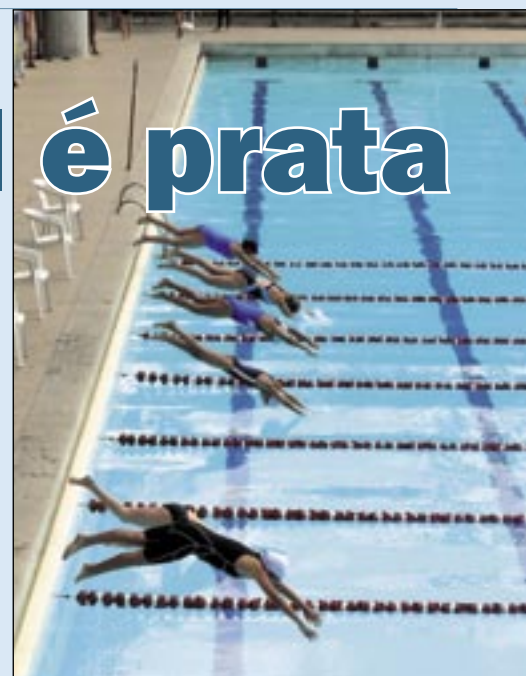
Estreantes do SESI no Clube do Trabalhador

A Escolinha de Natação do SESI levou para