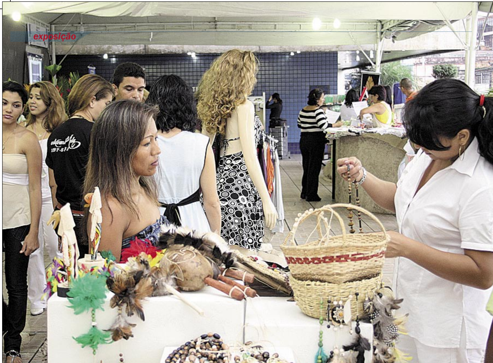
Artesanato indígena e produtos regionais e inovadores fazem parte da exposição "Sebrae mostra o que faz", montada mensalmente na área externa da sede da instituição