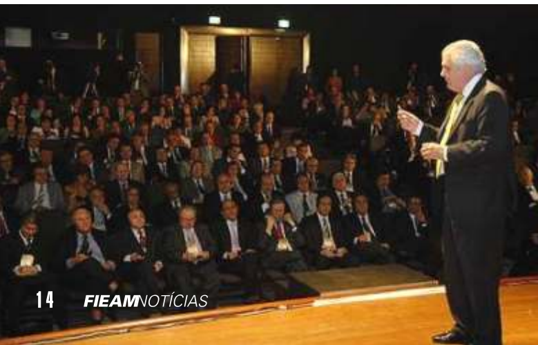
Representantes do IEL nas reuniões individualizadas