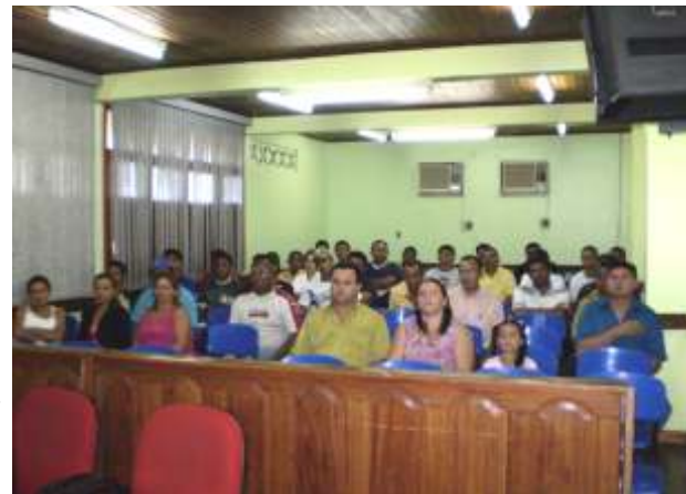
Empresários e colaboradores do pólo cerâmico no treinamento