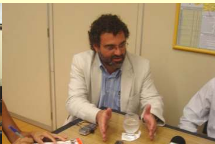
Viana: desafio é transformar a floresta em algo mais valioso em pé do que derrubada

presta serviço ao mundo e tem que ser remunerada ”, propõe. “ Prestamos serviço a um custo: não desmatar. Então, nada mais justo que sermos remunerados por isso ”, afirma.