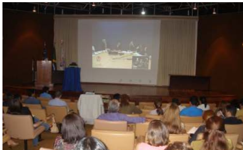
Videoconferência retransmitida pelo SENAI/AM

O SESI é uma das entidades brasileiras participantes da elaboração da norma ISO 26000 – Norma Internacional de Responsabilidade Social com a mobilização de empresários, promoção de reuniões técnicas e eventos nacionais.