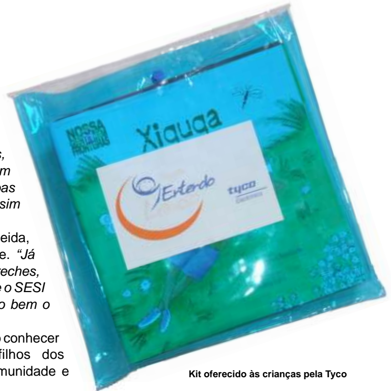
Kit oferecido às crianças pela Tyco

No final do projeto, os alunos que mais se destacarem vão conhecer as dependências da Tyco, juntamente com os filhos dos colaboradores da empresa, integrando crianças da comunidade e dependentes de industriários.