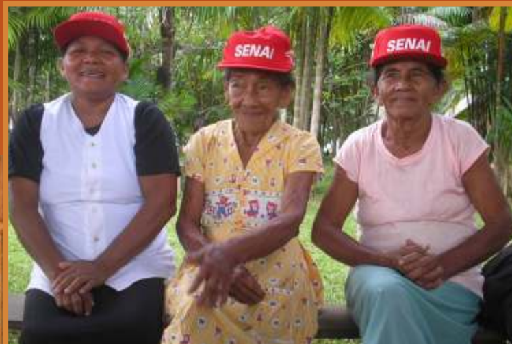
Treinamento para hotel atinge todas as idades